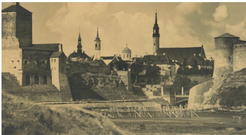
Kalatõkked Narva jõel. Taamal Narva ja Jaanlinna linnused ning Narva vanalinn. 1920.-1930. aastad. Erakogu.