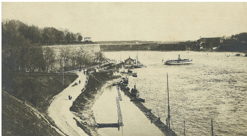
Pimeia tee, Narva paadisadam, taamal jõesadam. Karl Noormägi. Erakogu.

Kuningale näidati iidseid müüre ja bastione: Victoria, Horn, Vestervalli – kõik puha Rootsi nimed. Sadamatrepid olid kaetud punase vaibaga. Lipud, loorberipuud, kõmisev muusika. Bulvaril rahvast murdu. Kuningas läks jalgsi Pimeia mäest üles. Bulvaril peatuti ja valitsusliikmed selgitasid kuningale rootsi ja saksa keeles linna ajalugu.