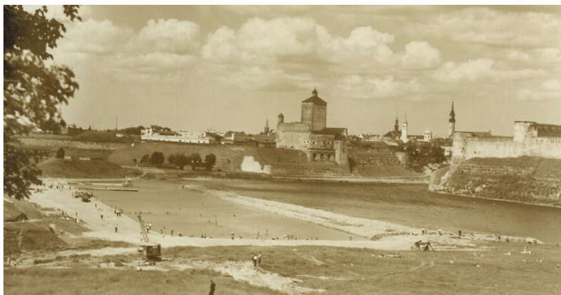
Narva jõebassein 1930. aastad.

Bassein sai suur ja vägev. Isegi võistlusbassein, hüppetorn ja „Jõe-kohvik“ löödi püsti. Narva linnale tekkis tore ja soliidne suvituskoht, otse keset linna. Rajati liivarand ja tee Joaorgu. Seal peeti ka laulupidu, killamänge ja kunglapäevi. Kahju oli ainult sellest, et rikuti ilusat, ürgset loodust. Vanasti olid Joaorus vanad hiigelpärnad, olid ilusad mäed ja looduslikud röövlikoopad. Nüüd kaevati ja murti sealt paasi. Juba tsariajal hakati jõe elektrijaama ehitama. Selleks kaevati kanal, mis jällegi lõhkus ilusat Joaorgu. Mingit looduskaitset tol ajal ei eksisteerinud. Hiljem lõhuti kogu Joaorg ja isegi linn.