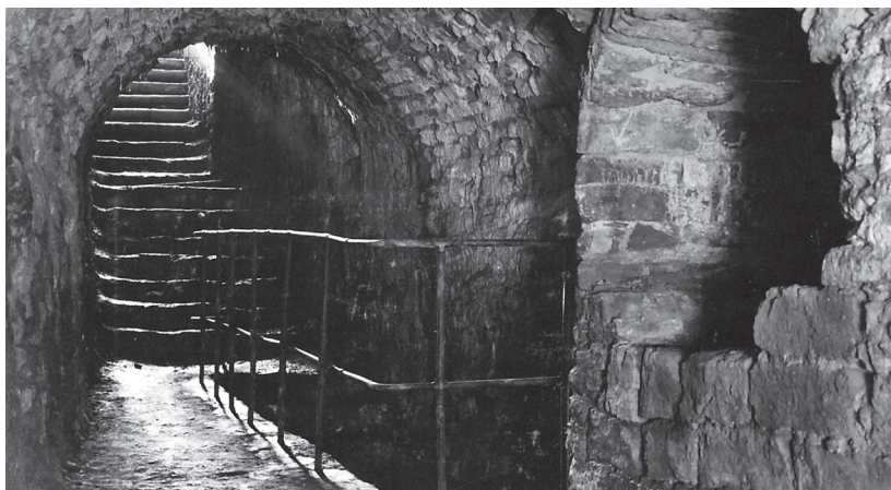
Victoria bastioni kasematt. 1920.–30. aastad. Tartu Ülikooli Kunstimuuseum.