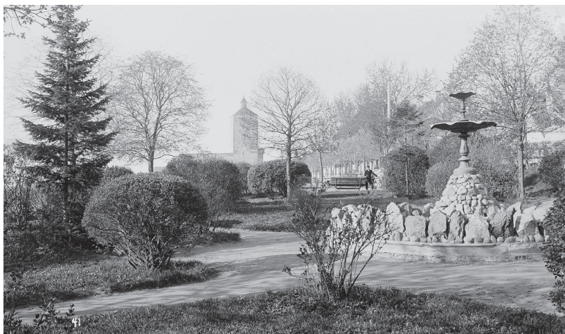
Purskkaev Väikeses Pimeaias. 1910. aastad.