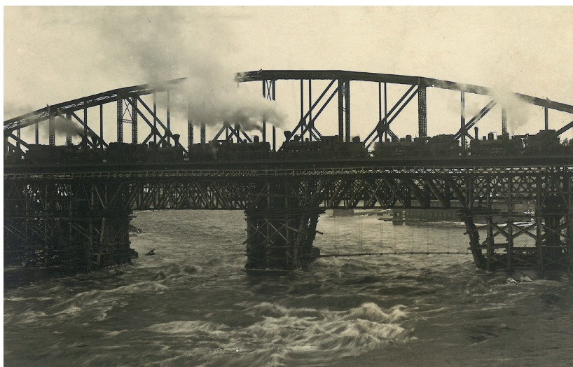
Raudsilla avamine aastal 1923. Erakogu.

Viimaks ujusime välja paksude basseini juurde, kus meil oli isegi tilluke liivarand päevitamiseks. Kaldaalune oli täis suuri paekive ja sinna oli raske juurde pääseda. Harilik surelik sinna ei tikkunud.