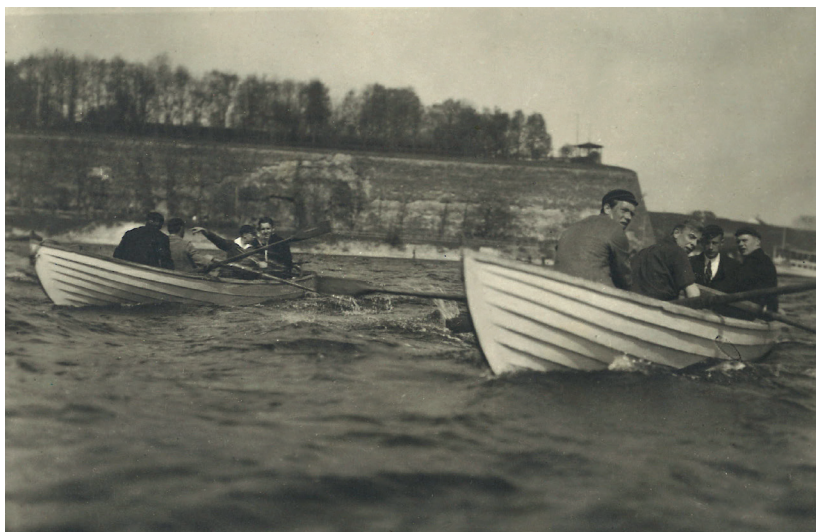
Koolipoisid Narva jõel Victoria bastioni all.

Lutsul oli ka auto – vist üldse esimene auto Narvas – ja kui see signaali andis, siis mängis justkui puhkpilliorkester. Suunanäitajaks oli ilmatu pikk punasetriibuline semafor, mis välja lükates kõikus nagu päris rusikas. Kui ette jäid, võisid sellega vastu pead saada. Koerad jooksid ta autole suure kisaga järele.