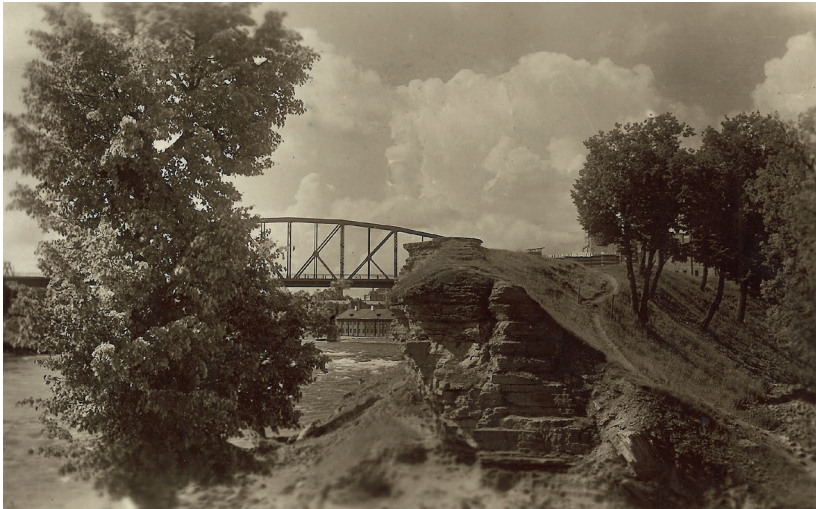
Joaoru Röövlikoopad. 1930. aastad.