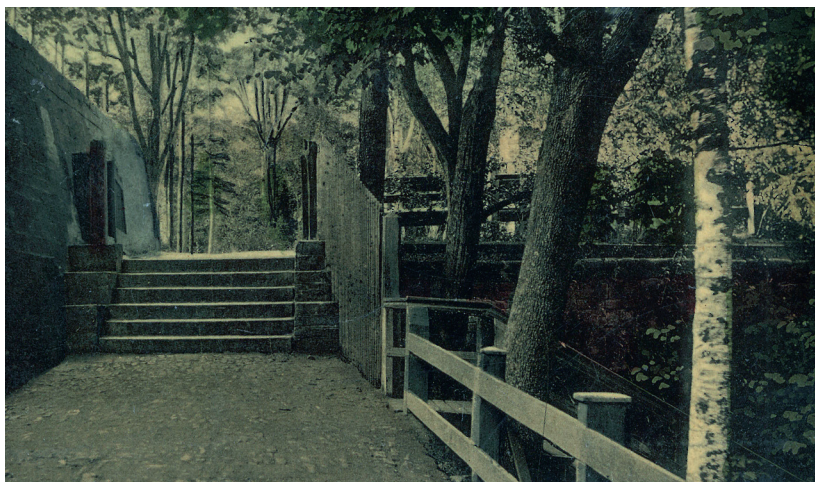
Pimevärav. 1910. aastad. Erakogu.